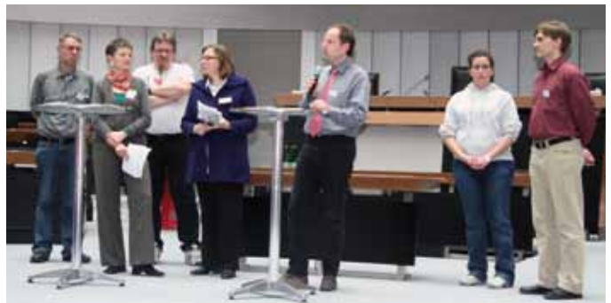
Präsentation der Workshopergebnisse