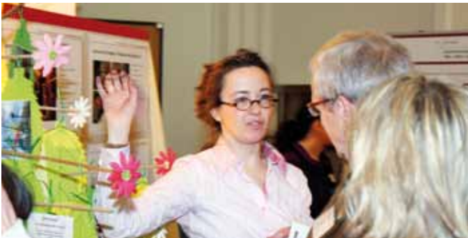
Projektpräsentationen der Quartiere