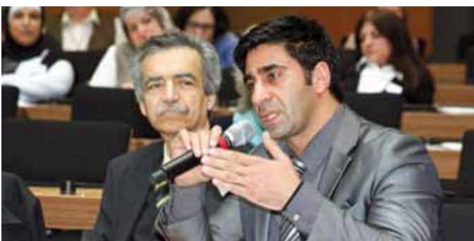
Abschließende Diskussion ...