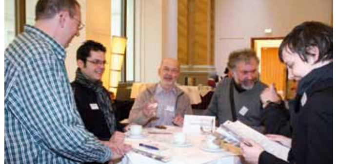
Gute Laune und angeregte Diskussionen schon vor Beginn der Plenarveranstaltung