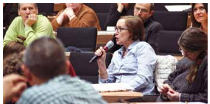
... zu den Ergebnissen des Tages