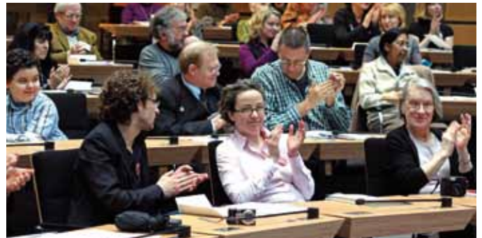
Während der Begrüßungsreden und den Berichten aus den Quartieren