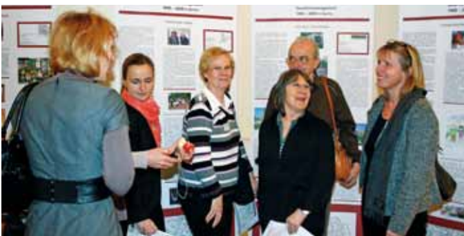
Begegnungen vor den Schautafeln "10 Jahre Quartiersmanagement in Berlin" zur Kaffeepause