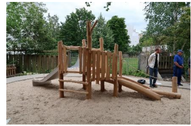
Aktiv Spielgerät