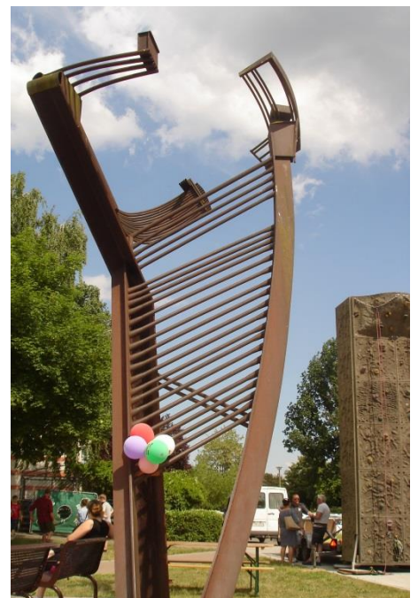
Außenbereich des Jugendclubs „Wurzel“

Senatsverwaltung für Stadtentwicklung und Wohnen