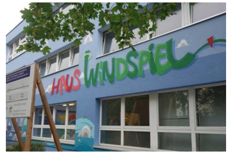
Kinder- und Jugendfreizeiteinrichtung „Haus Windspiel“