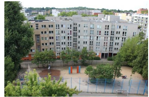
Wohnhäuser in der Werner-Düttmann-Siedlung