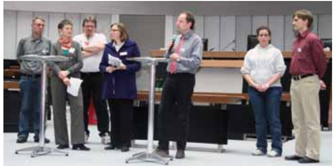
Präsentation der Workshopergebnisse