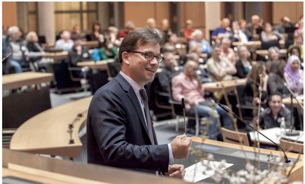
Florian Pronold, Parlamentarischer Staatssekretär bei der Bundesministerin für Umwelt, Naturschutz, Bau und Reaktorsicherheit

„Mit dem, was Sie ehrenamtlich vor Ort machen, tragen Sie dazu bei, dass unsere Gesellschaft zusammenhält. Gegen Ausgrenzung, gegen Diskriminierung und soziale Kälte setzen Sie ganz konkret mit Ihrem Handeln etwas, das die Berliner Kieze lebens- und liebenswerter macht. Das würde ohne Sie nicht funktionieren. Dieses Lob haben Sie wirklich verdient!“