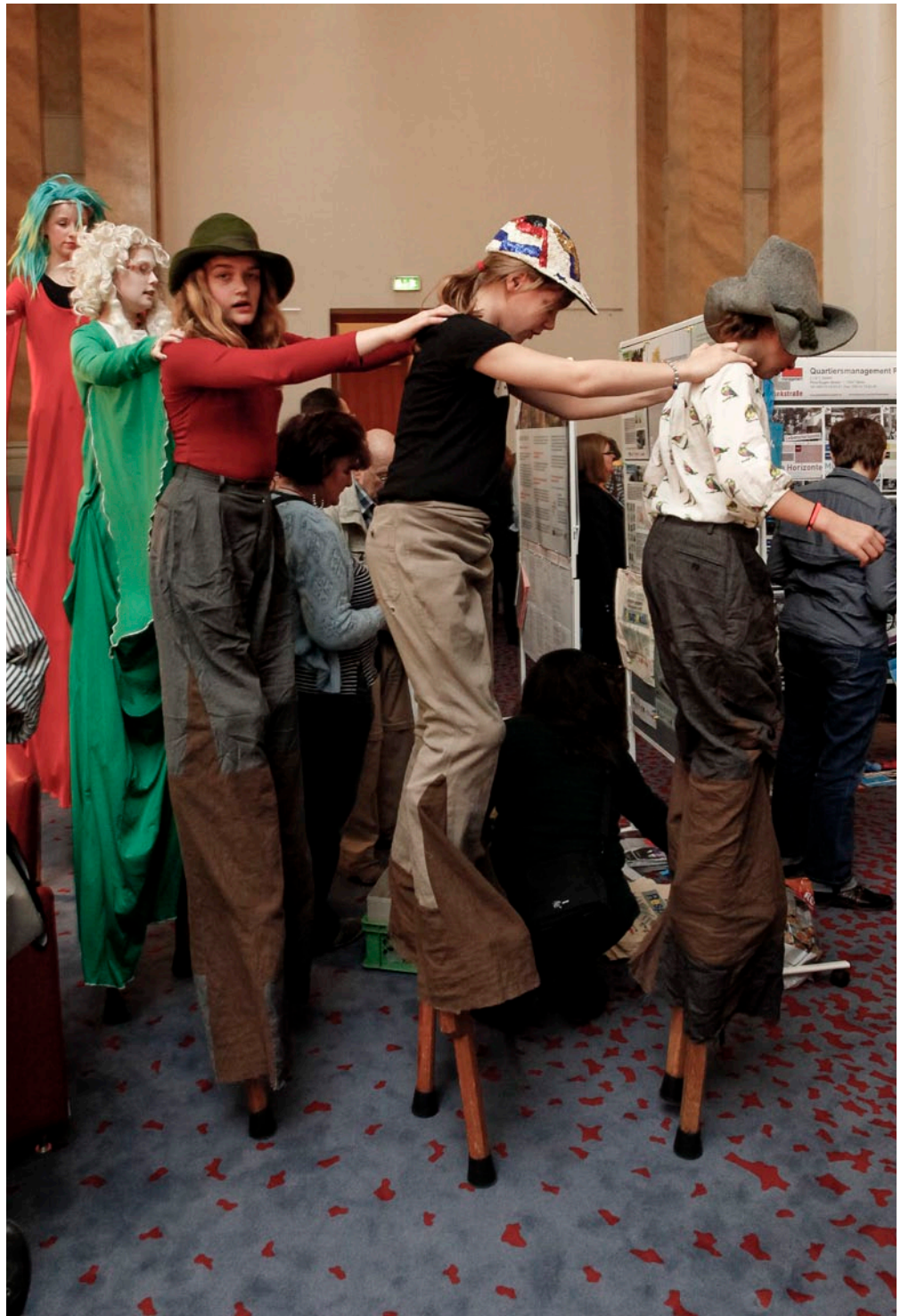
Begrüßung durch die Kinder des Zirkus Zack

Für die Unterhaltung sorgten an diesem Tag die Mädchen vom „Kinder- und Jugend-Zirkus Zack“ und dem Kinderchor „Friedrichshainer Spatzen“. Das Circusmusical „Cir-Chor-Ical“ verbindet Musik und Tanz mit artistischen Einlagen und hebt die Märchenwelt aus den Angeln.