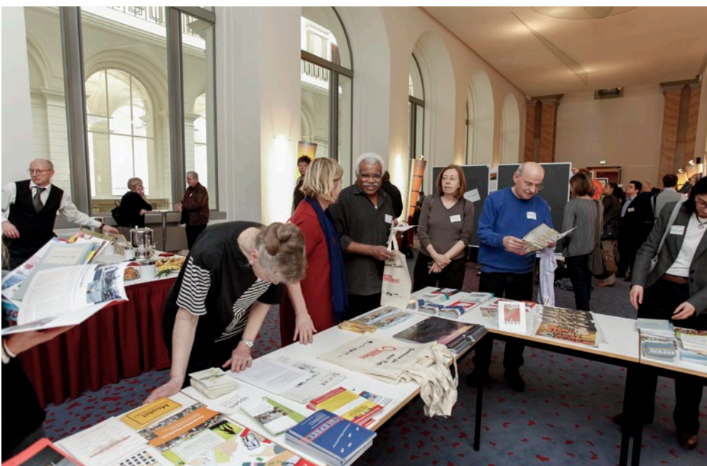
Nachgefragt: Informationen zu den Berliner Quartiersmanagementgebieten