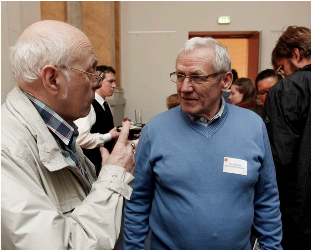
Lebhafte Diskussionen: Quartiersräte tauschen ihre Erfahrungen aus