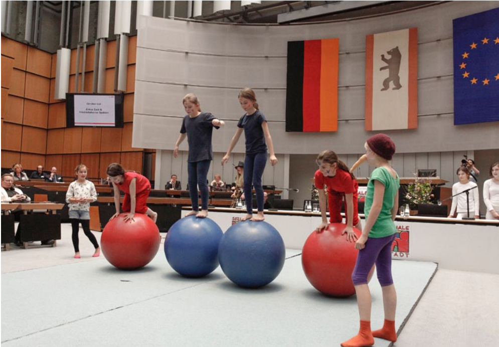
Abgeordnetenhaus mal anders: Artistinnen bei der Arbeit