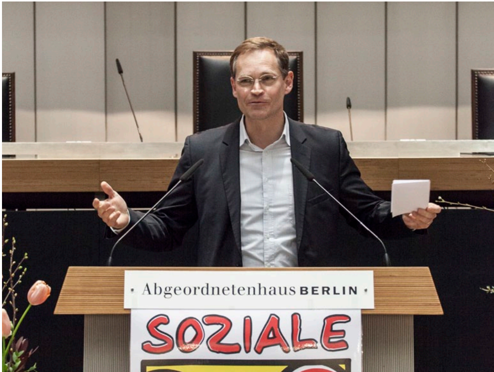
Michael Müller, Senator für Stadtentwicklung und Umwelt

Die Entwicklung Berlins als wachsende Stadt sozial zu begleiten, wird eine der großen Herausforderungen der kommenden Jahre sein, denen sich die gesamte Stadtgesellschaft stellen muss. Nicht nur Kunst, Kultur und Wissenschaft, Dynamik und Vielfalt machen diese Stadt aus, sondern auch und vor allem die Menschen, die mit ihren Besonderheiten ihre Nachbarschaft in den Berliner Kiezen prägen.