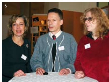
3) Cross Over: Mitglieder des Quartiersrates Falkenhagener Feld Ost und West

Aus der Diskussion im Vorfeld des Kongresses, am Kongresstag selbst und in der anschließenden Diskussion haben sich folgende Punkte herauskristallisiert: