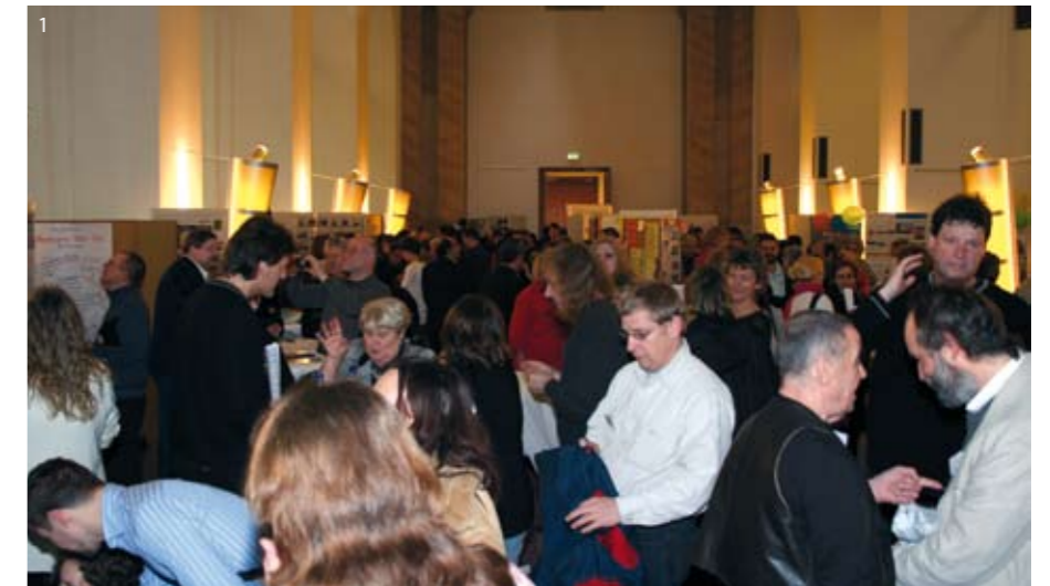
1. Phase: Erarbeitung eines Handlungskonzeptes, Aufbau von Strukturen 2. Phase: Stabilisierung

Ein Vorschlag für ein vierstufiges Phasenmodell kann wie folgt gegliedert sein: