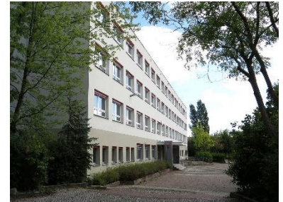
Haus 1 der Marcana-Schule