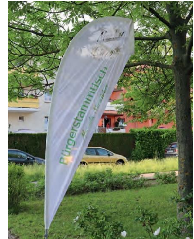
Werbung für den Bürgerstammtisch