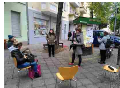
Fotoworkshop der Medienwerkstatt (QM Donaustraße Nord)