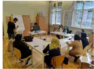
Mediencafé in der Rixdorfer Schule (QM Donaustraße Nord)

Die Mitarbeit an der Zeitung erfreut sich inzwischen großer Nachfrage. Die Kiezredaktion besteht aus mehreren ehrenamtlichen Mitgliedern aus der Nachbarschaft sowie Kooperationspartnerinnen und -partnern, die es sich gemeinsam zum Ziel gemacht haben, das erneuerte Stadtteilmedium barrierefreier, mehrsprachig sowie multimedial zu gestalten.