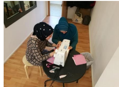
Eltern im Nähcafé

Zudem sollen Eltern ermutigt werden, schulische Belange aktiv mitzugestalten. Die Schulgremien eignen sich gut, um Eltern zu aktivieren, zu wichtigen Themen zu informieren und Selbstbewusstseins der Eltern insbesondere gegenüber der Institution Schule zu stärken.