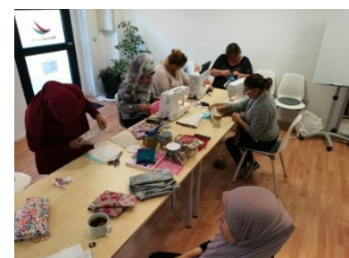
Eltern im Nähcafé