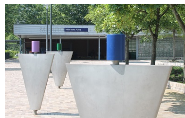
Klangpfad auf dem Vorplatz des S-Bahnhofs Mehrower Allee