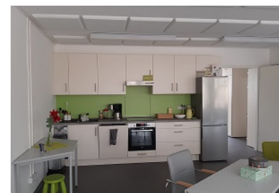
Eine moderne Küche im offenen Elterntreff