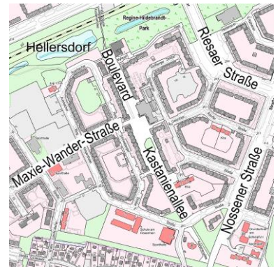
Geoportal Berlin / Karte von Berlin 1:5000

In einer ersten Phase werden unterschiedliche Baumaßnahmen umgesetzt. Dazu gehören die Aufwertung des zentralen Platzes und der Eingangssituationen des Boulevards und die Schaffung attraktiver Aufenthalts- und Grünflächen mit neuen Sitzelementen. Bestehende Spielflächen sollen erneuert und durch Aktions- und Bewegungsflächen für verschiedene Alters- und Zielgruppen entlang des Boulevards ergänzt werden. Ab dem Sommer 2019 werden die Ausschreibungen für die Baumaßnahmen durchgeführt, damit die Baumaßnahmen bis Ende 2020 umgesetzt werden können.