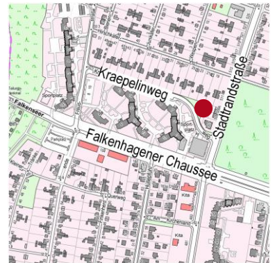
Geoportal Berlin / Karte von Berlin 1:5000