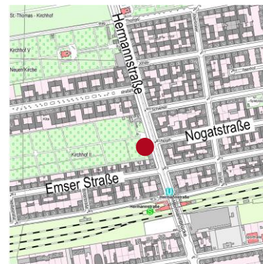
Geoportal Berlin / Karte von Berlin 1:5000

Bei der Realisierung des Vorhabens wird mit zahlreichen Kooperationspartnern zusammengearbeitet, unter anderem der Schöpflin Stiftung, dem Bund Deutscher Gartenfreunde, der Nomadisch Grün gGmbH (Prinzessinnengärten), dem Diakonischen Werk Berlin Stadtmitte und dem Campus Cosmopolis e.V.