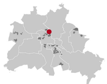
QM Soldiner Straße/Wollankstraße